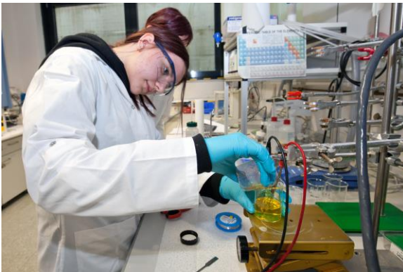
Teilnehmerinnen veredeln Schmuck mit Hilfe der Galvanotechnik

Rund 60 Schülerinnen erhielten einen praktischen Einblick in die Arbeitsbereiche der Forschungsinstitute.